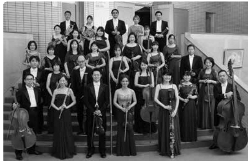
長崎 OMURA 室内合奏団

シーハットおおむら（さくらホール）を拠点に、プロの室内オーケストラとして、県内在住及び出身演奏家を中心に2003年結成。アーティスティック・アドバイザーに松原勝也（ヴァイオリン）を迎え、演奏力や音楽性の向上に努め質の高い室内オーケストラを目指している。ホールでのコンサートのほか、スクールコンサート等の青少年育成事業や地域の教会・寺院等でのアウトリーチコンサートにも精力的に取り組んでいる。日本オーケストラ連盟準会員。