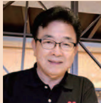
シム・ソンハック テノール(韓国)