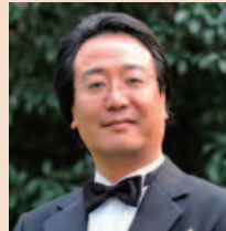
チョウ・ジンホア テノール(中国)