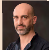
カタルド・ルッソ (イタリア)