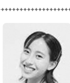
メゾソプラノ 信太 美紗生