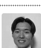
テノール 並木 晴二郎