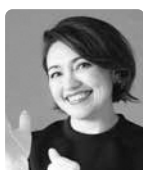
指揮者 コロン えりか