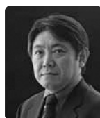
バリトン 河野 克典